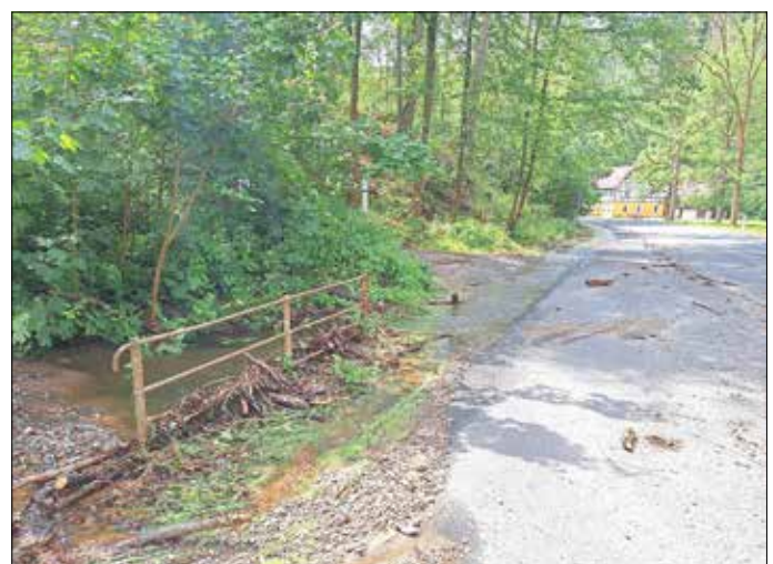
Durchlass Bärenhohlflüsschen im Polenztal

Die Bergstraße zwischen Goßdorf und Kohlmühle muss leider weiter gesperrt bleiben. Der neu entstandene Schaden muss begutachtet und beseitigt werden. Wir bitten um Verständnis.