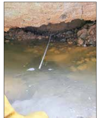
Unterspülte Mauer an der Bergstraße Goßdorf